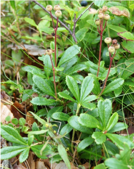
Ryl vid Hulebo